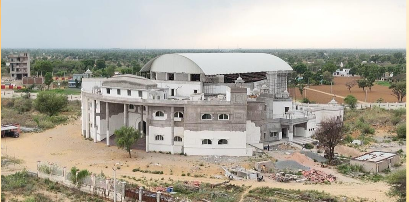
*Construction Work in Progress