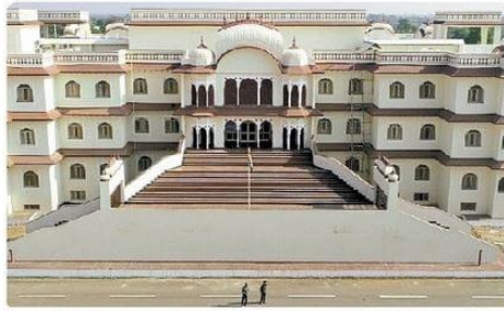
सीकर. शेखावाटी विश्वविद्यालय का अकादमिक भवन (फाइल फोटो)

सीकर. यह उच्च शिक्षा हासिल करने वाले शेखावाटी क्षेत्र के विद्यार्थियों के लिए अच्छी खबर है। पंडित दीनदयाल उपाध्याय शेखावाटी विश्वविद्यालय, सीकर में 3.30