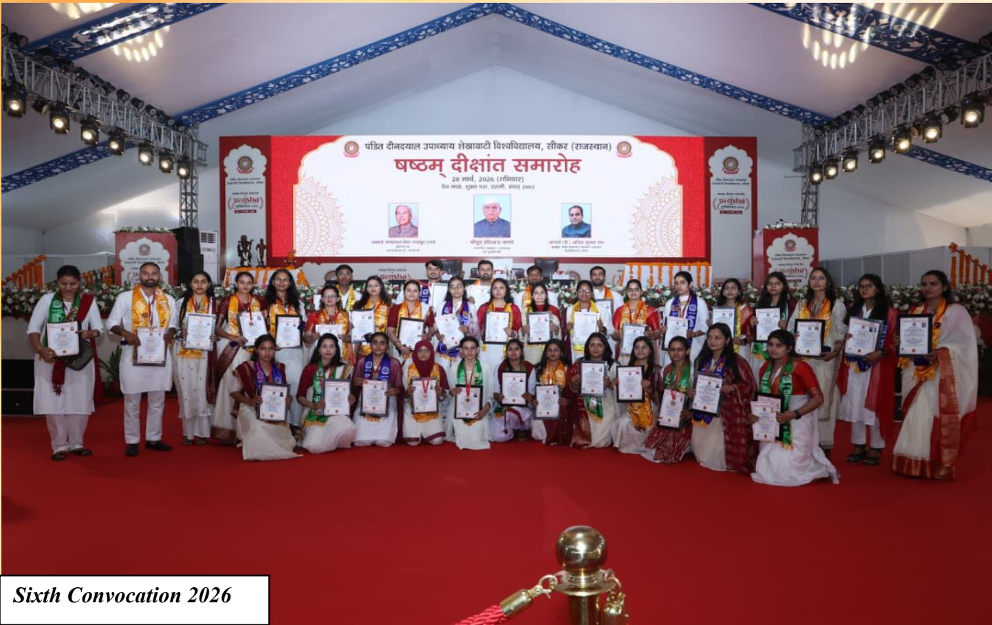
Sixth Convocation 2026