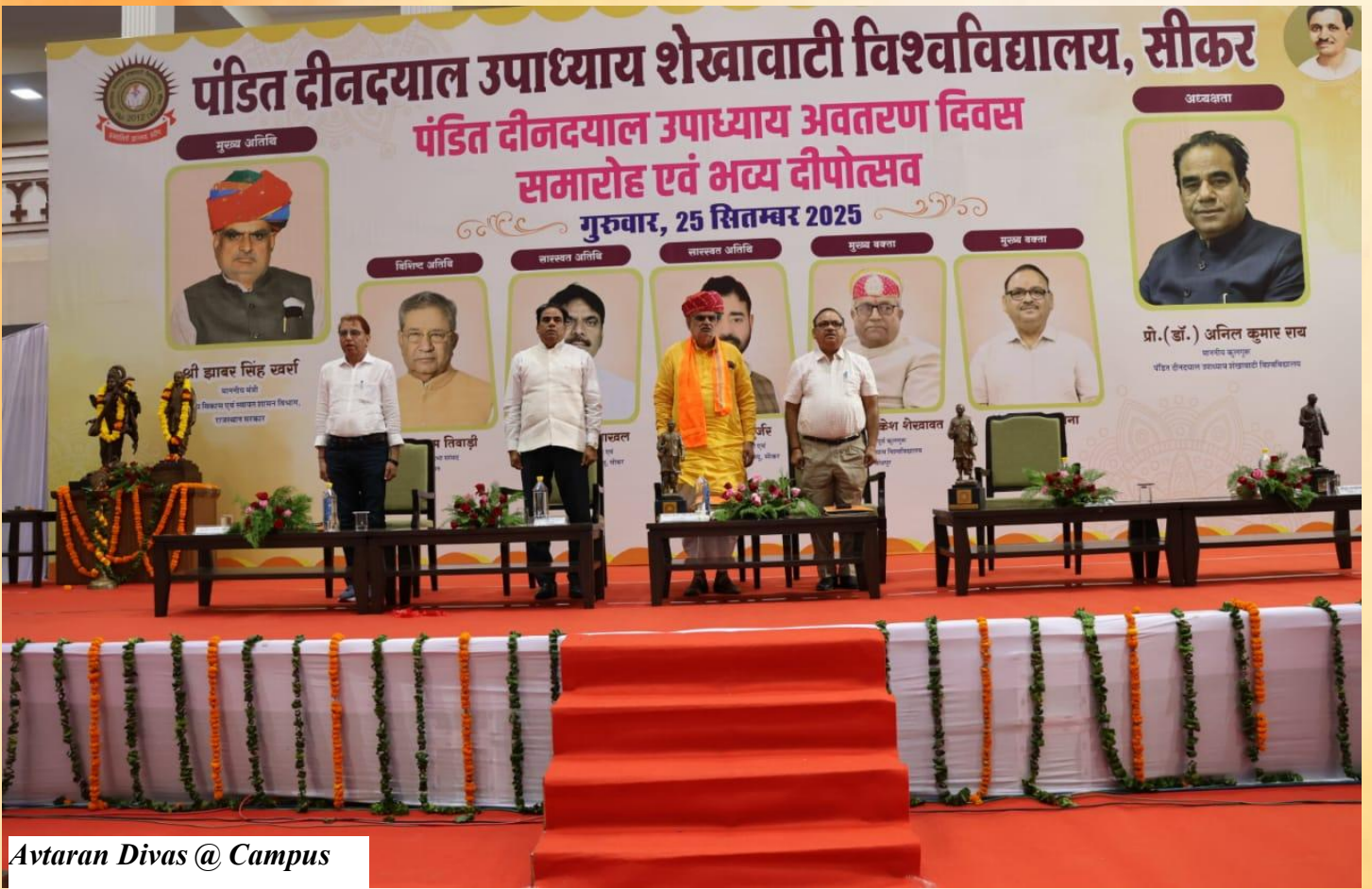
Avtaran Divas @ Campus