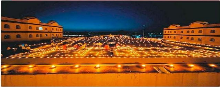
सीकर, दीपों से रोशन शेखावाटी विश्वविद्यालय और मंचवथ अतिथि व गणमान्यजन।