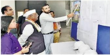
सीकर. विवि में निरीक्षण के दौरान राज्यपाल को कार्यों की जानकारी देते हुए।