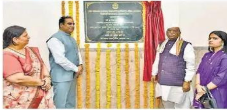
सीकर. विवि परिसर में विकास कार्यों का लोकार्पण करते राज्यपाल बागड़े।