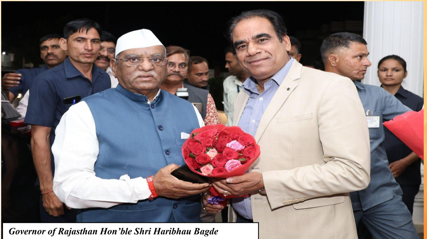
Governor of Rajasthan Hon'ble Shri Haribhau Bagde