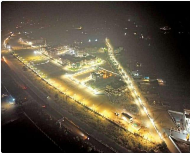
पॉलिनी लानु कर दी गई है। खलौन बनाया गया है। रात के समय विश्वविद्यालय कैंपस को ग्रीन और लाइटों में भवन व कैंपस जगमग दिखाई देता है। शेखावाटी दो माईमास्क लाइटों से रोशन किया गया है।

विश्वविद्यालय में सीकर, झुंझुनू और नीमकाथाना जिलों के करीब 575 कॉलेज संबद्ध हैं, जिनमें निरमित व स्वयंघोषी करीब 4.25 लाख विद्यार्थी अध्ययन कर रहे हैं। शेखावाटी यूनिवर्सिटी के सभी यूजी व पीजी कोर्सेज में न्यू एजुकेशन