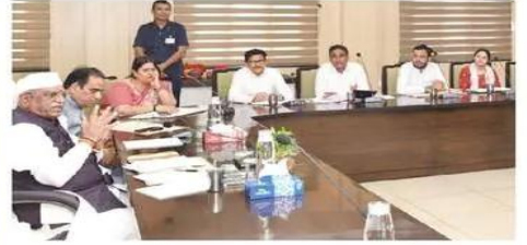
बैठक के दौरान अधिकारियों को निर्देश देते राज्यपाल बागड़े।