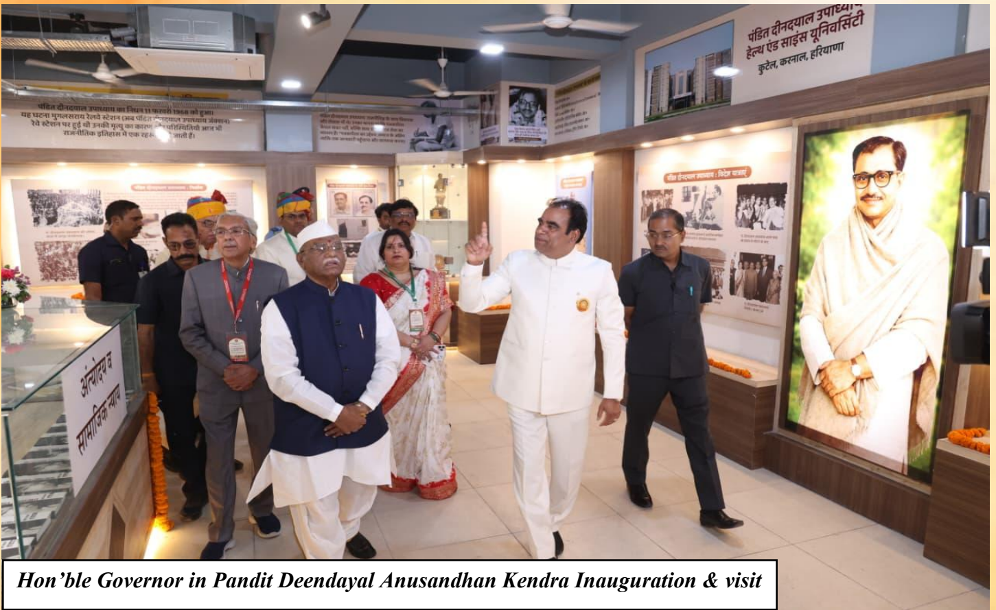
Hon'ble Governor in Pandit Deendayal Anusandhan Kendra Inauguration & visit