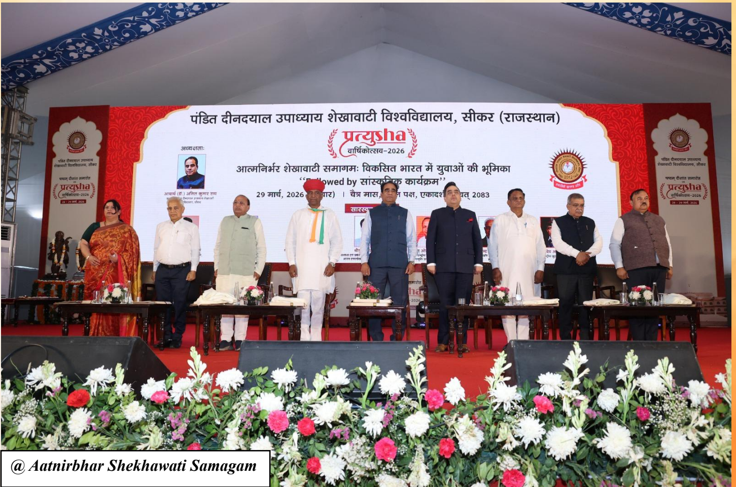
@ Aatnirbhar Shekhawati Samagam