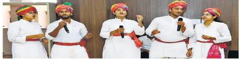
सीकर. विश्वविद्यालय के वार्षिकोत्सव के दौरान सांस्कृतिक प्रस्तुति देते स्टूडेंट्स।