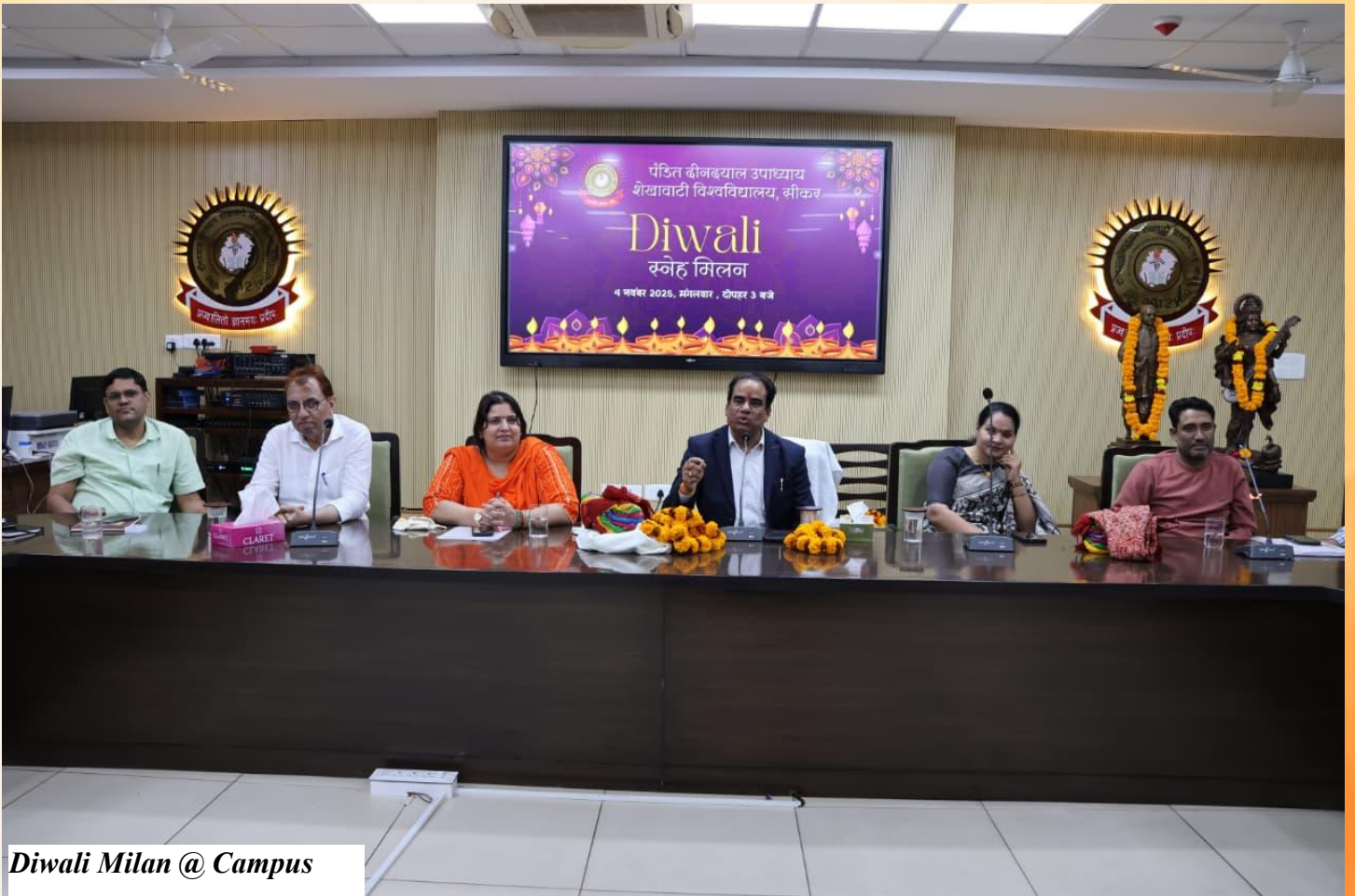
Diwali Milan @ Campus