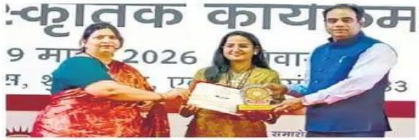
शेखावाटी विश्वविद्यालय के वार्षिकोत्सव में सम्मान करते कुलगुरु राय।