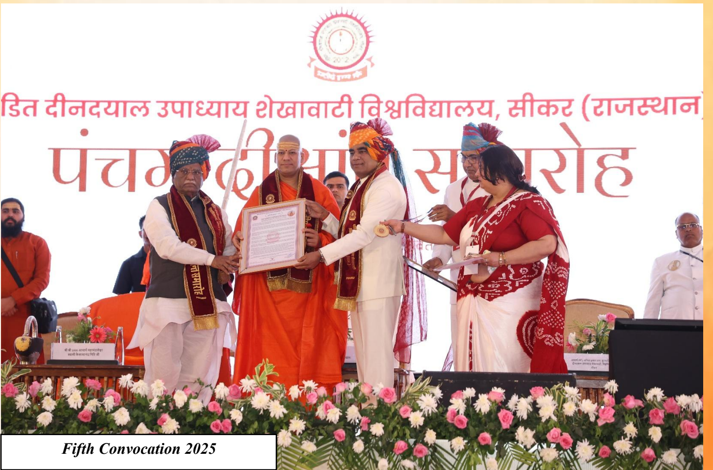
Fifth Convocation 2025