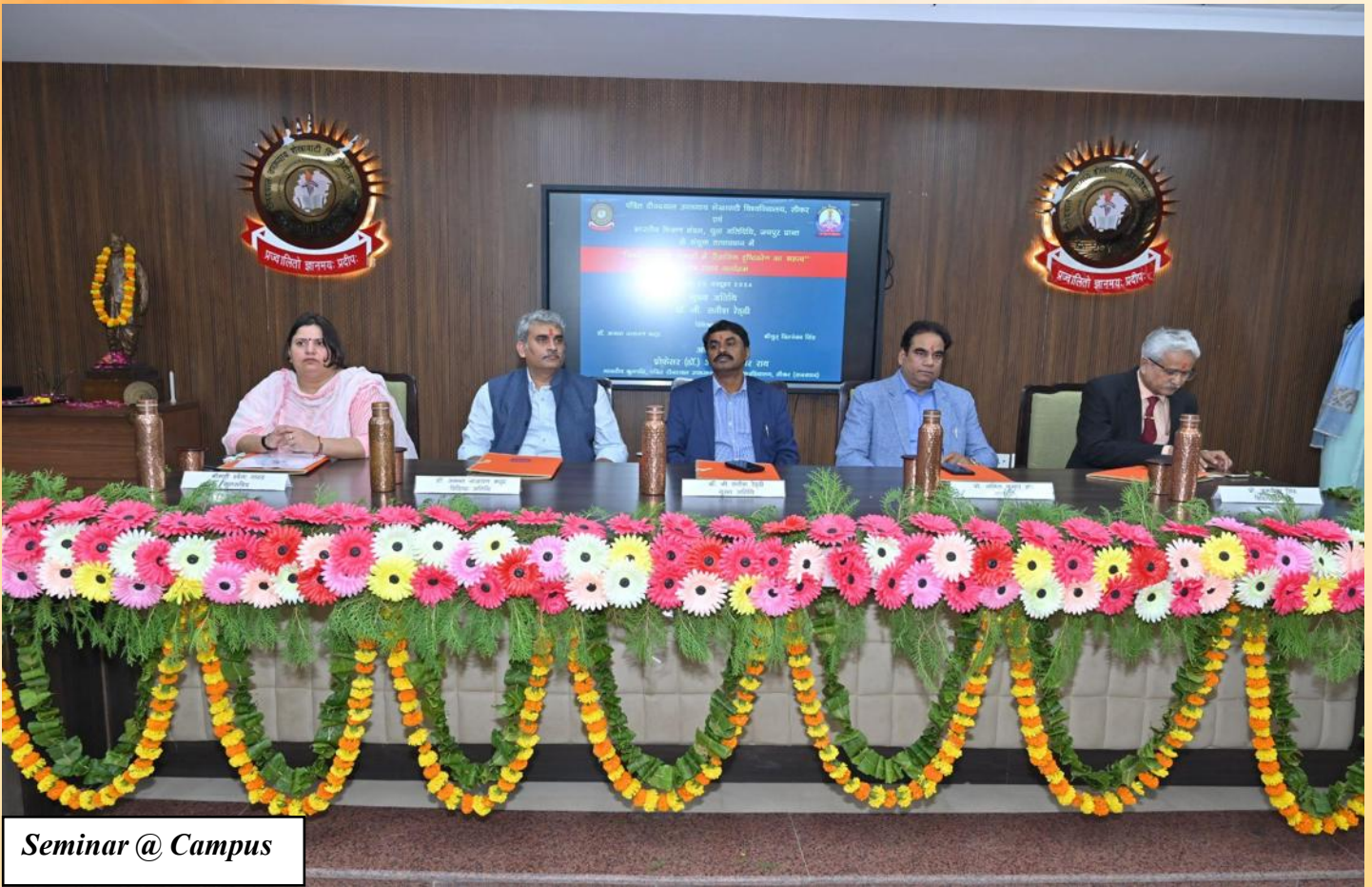
Seminar @ Campus