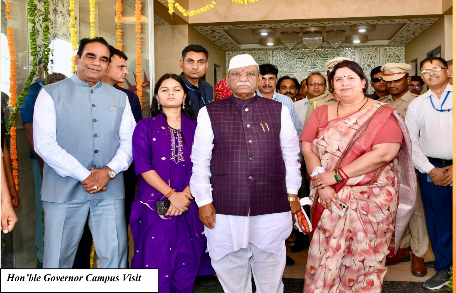
Hon'ble Governor Campus Visit