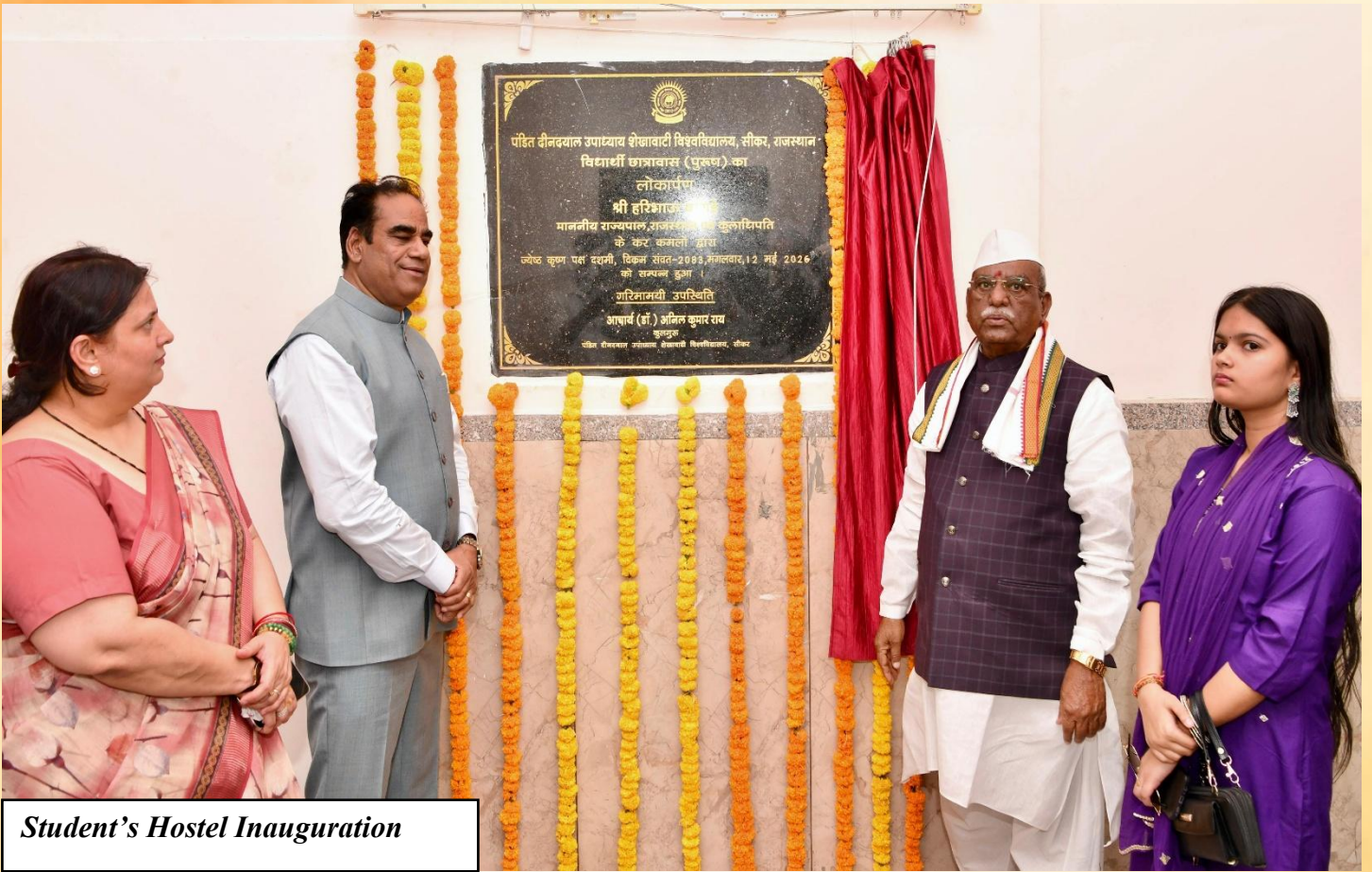
Student's Hostel Inauguration