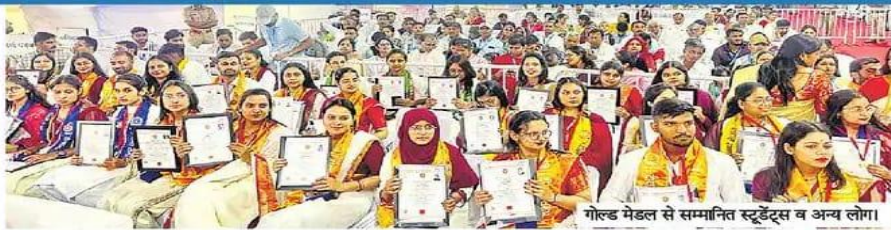
गोल्ड मेडल से सम्मानित स्टूडेंट्स व अन्य लोग।

राज्यपाल ने समारोह में 39 छात्र-छात्राओं को गोल्ड मेडल से सम्मानित किया। इसमें 33 बेटियां व 6 लड़के शामिल थे। कला संकाय के 34846, विज्ञान संकाय के 15743, वाणिज्य संकाय के 3362, समाज विज्ञान संकाय के 12457, शिक्षा संकाय के 24232 व विधि संकाय के 38 स्नातक व स्नातकोत्तर स्टूडेंट्स की उपाधियां जारी की गईं। इस दौरान को कुछ प्रदान भी की