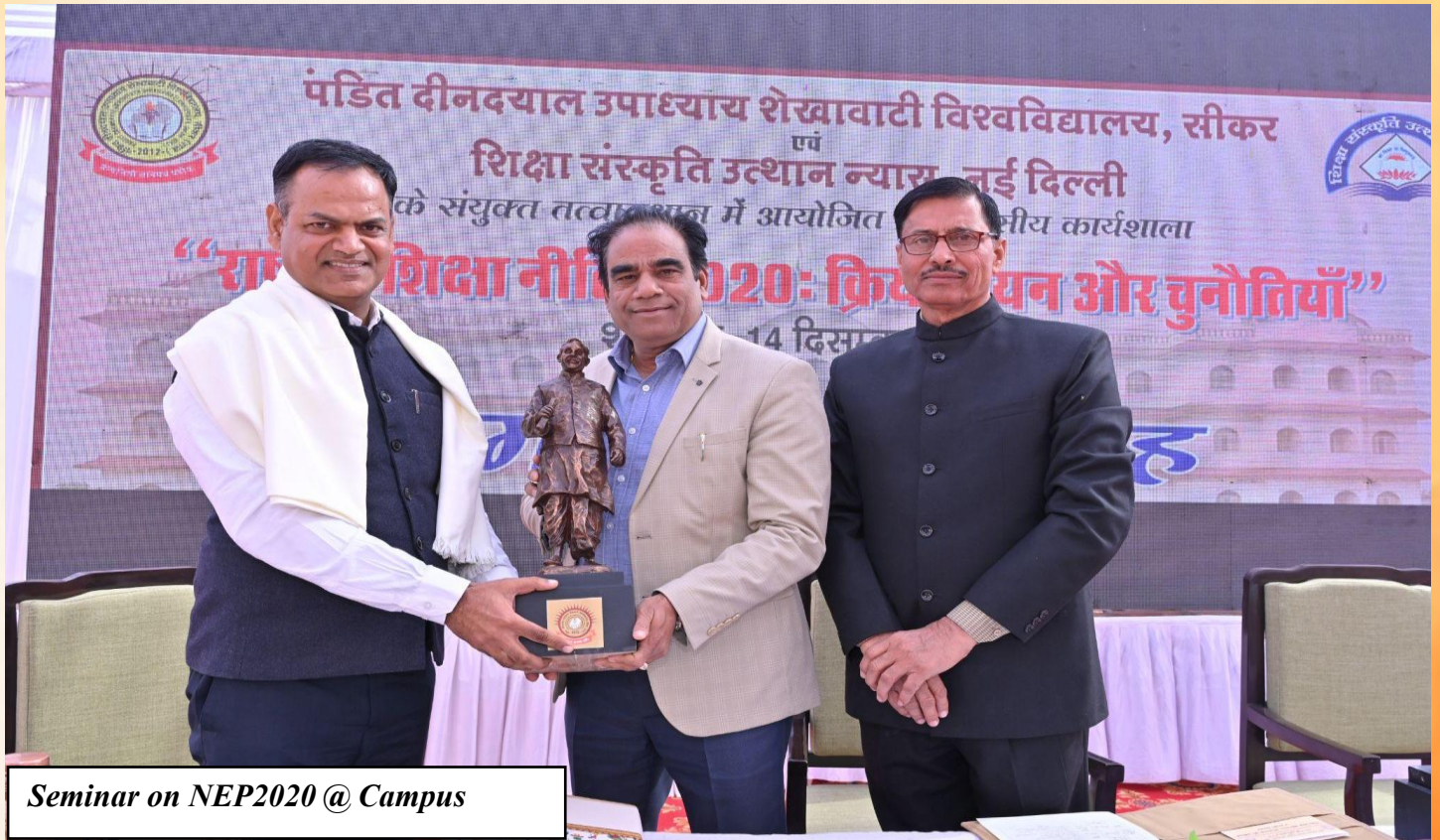
Seminar on NEP2020 @ Campus