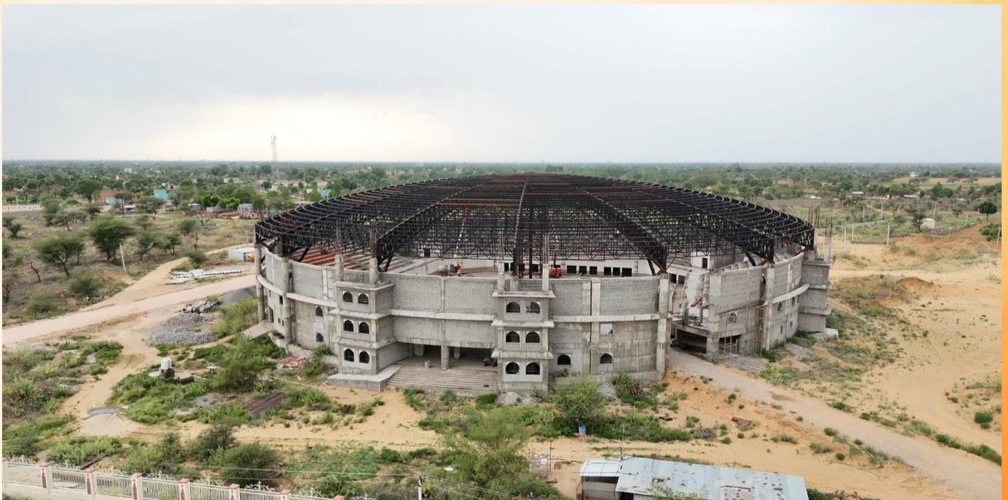
*Construction Work in Progress

Keeping in view the overwhelming importance of sports in overall development of personality of our students, the university has laid special emphasis on activities of Sports and Games. Regular intercollege tournaments in various events are conducted by the Department of Sports in various colleges affiliated to the university. In order to conduct all indoor sports activities, a grand Indoor Sports Complex is being constructed in the University Campus with world class amenities and facilities to nurture the young sportsmen.